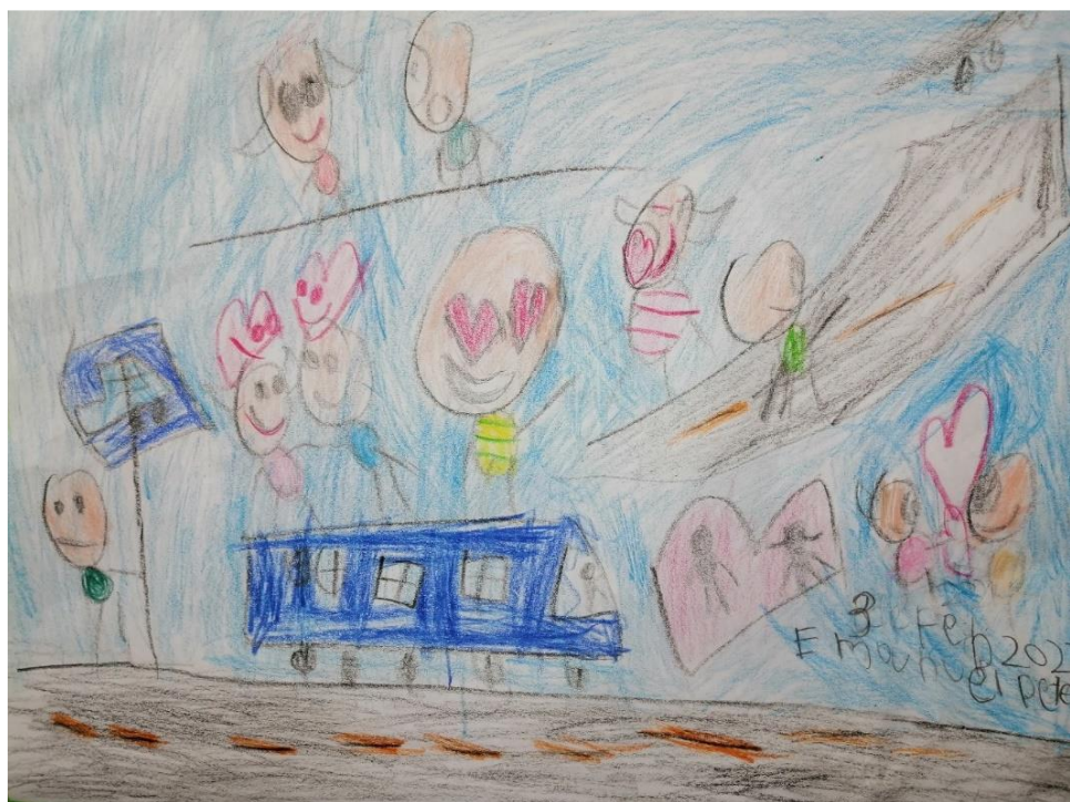
La amorosa Bogotá