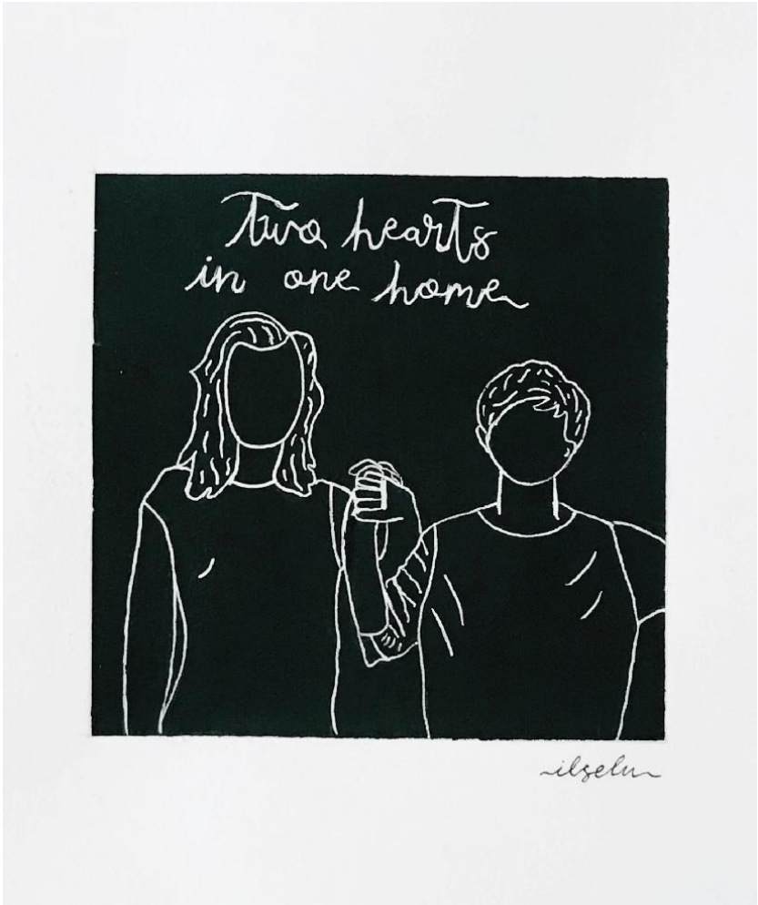
Two hearts in one home