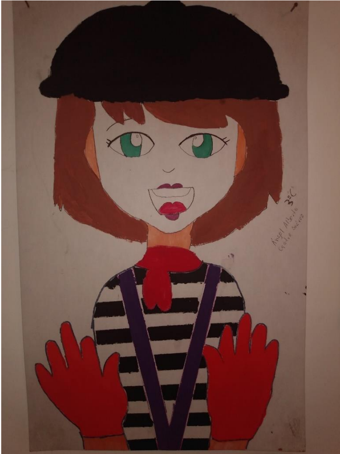
El mimo y la amistad